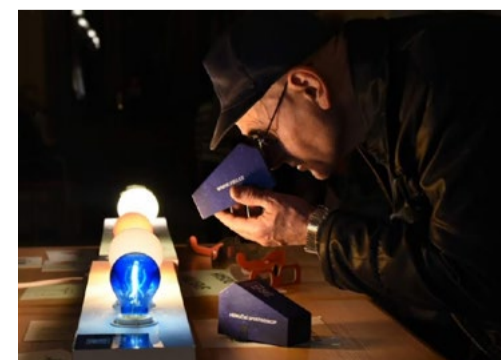
Správný úhel spektroskopu vůči zdroji

Pozor, se spektroskopem se nikdy nedívej do Slunce, hrozí vážné poškození zraku!