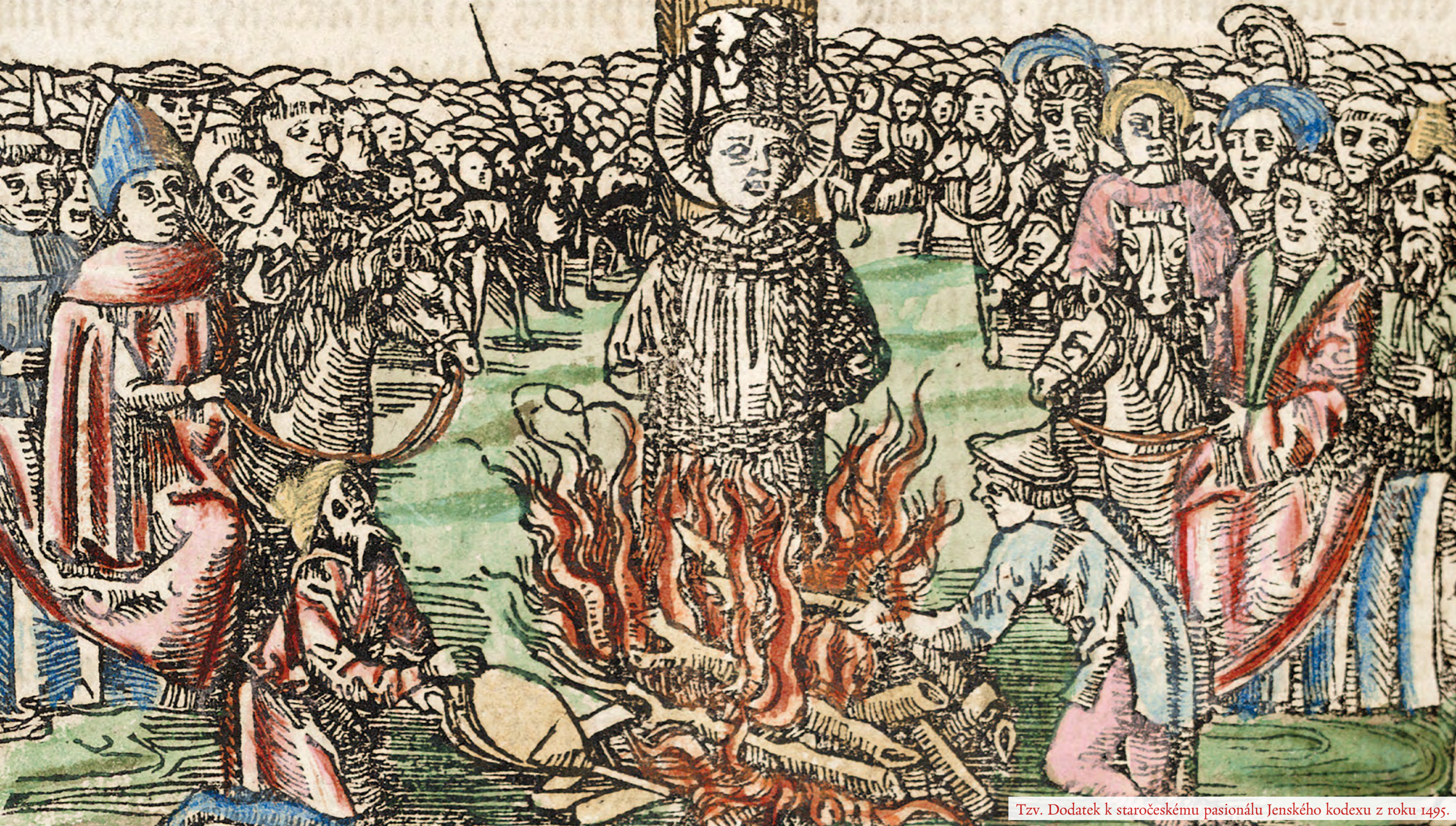
Tzv. Dodatek k staročeskému pasionálu Jenského kodexu z roku 1495.