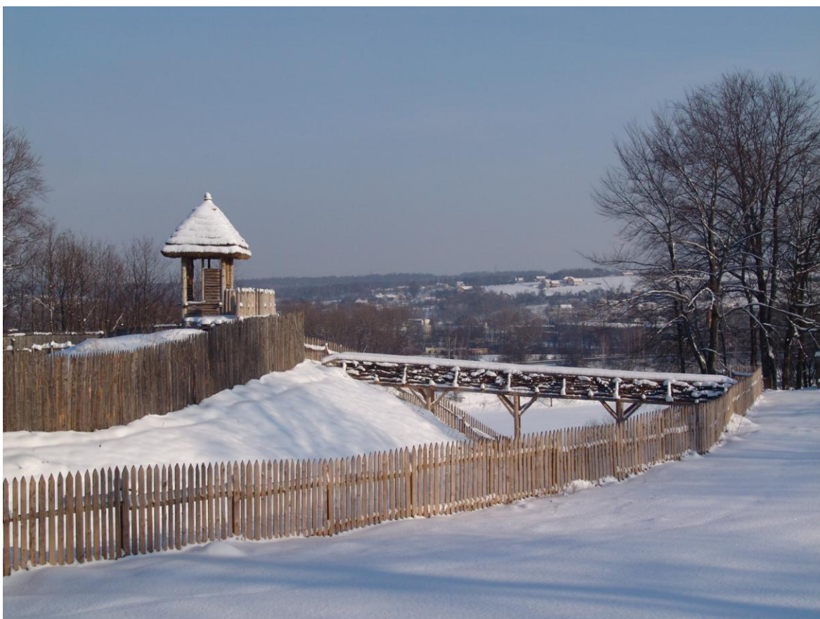
Chotěbuz – Podobora. Rekonstruovaný úsek opevnění slovanského hradiště, soustavně zkoumaného Archeologickým ústavem AV ČR, Brno, v. v. i.

IČ: 68081758 Sídlo: Královopolská 147, 612 00 Brno