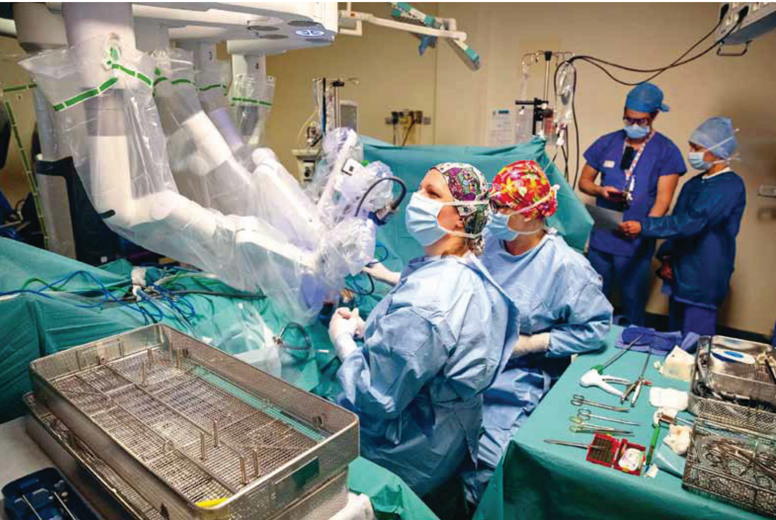
Hrubé síly netřeba. (Lékařky v pařížské nemocnici operují za použití robotického systému)

v posledních letech rostou a platové nůžky se mírně zužují, rozdíly v odměňování jsou v Česku – jak všichni víme – pořád jedny z největších v Evropské unii (zhruba dvacet dva procent). Největší propast je právě mezi ženami a muži s vysokoškolským vzděláním (necelá třetina). To je ovlivněno řadou faktorů: ženy častěji pracují v oborech, které jsou hůře hodnocené (školství, zdravotnictví), méně se hlásí na řídicí pozice, nejsou tolik jako muži zvyklé si říkat o vyšší platy. Jisté je, že pokud ženy v minulosti často slyšely, že jednou z příčin jejich nižších výdělků je jejich nedostatečná kvalifikace, nyní se ukazuje, že to byl pouze jeden z faktorů. Mnohem větší roli hrají další společenské vlivy.