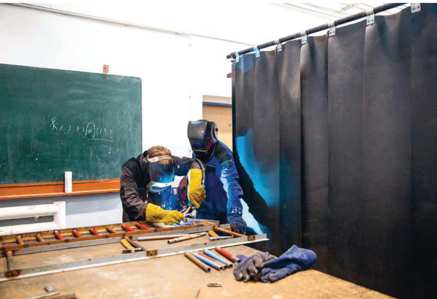
Kdopak je to pod helmou? (Střední škola technická v Opavě)