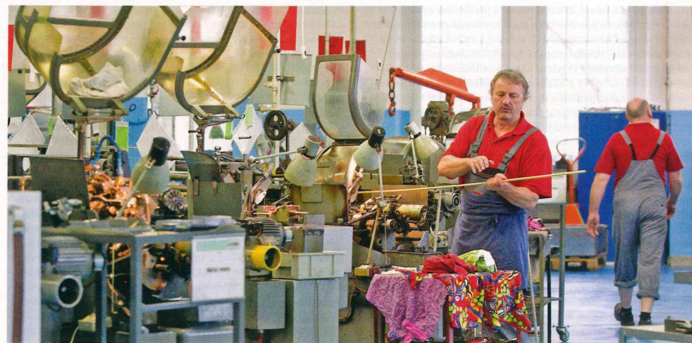
Česko je i čtvrt století po pádu železné opony stále především levnou montovnou součástek pro drahé zahraniční výrobky

Konečně tu jsou pak dva důvody stěžejní, jež spolu úzce souvisejí. Nezmění-li se, budeme pořád platit za chudé příbuzné západních zemí. Češi svým způsobem doplácí na to, že hlavním tahounem české ekonomiky je průmysl, který se na domácím HDP podílí takřka z poloviny. Jelikož je průmysl investičně výrazně náročnější než služby, musí si podniky dávat stranou na investice více peněz a na výplatu tak zbude méně. Co je ještě důležitější, české firmy většinou vyrábí meziprodukty, tedy součástky, které se vyvezou a teprve v zahraničí z nich vzniknou hotové výrobky. Cena součástek je logicky nižší než cena hotového zboží, a tak mají čeští zaměstnanci také nižší platy. S tím úzce souvisí i faktor druhý – tak často zmiňovaná nízká produktivita práce v Česku. Nejde ani tak o to, že by snad čeští zaměstnanci byli línější či