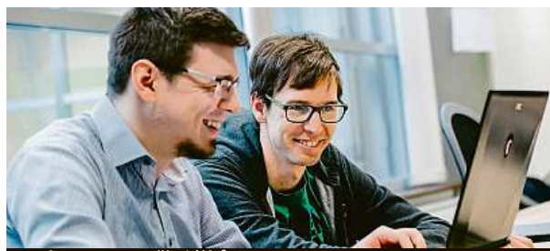
Budoucnost patří ajťákům.

Třetina podniků v příštích dvou letech očekává radikální změnu – od produktů, které prodávají, až po místo, kde pracují. Zatímco investice do technologií, jako je například robotika, stále kralují výdajovým plánům, firmy podle průzkumu finanční společnosti HSBC začínají čím dál více investovat do spokojenosti a nových dovedností svých zaměstnanců. MET