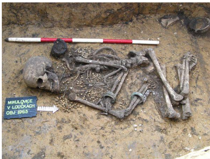
Kostrový pohřeb ženy únětické kultury z Mikulovic (Pardubice). Součástí pohřební výbavy jsou kromě keramických nádob zejména jantarové korálky, bronzové jehlice a bronzové náramky. Ca 2000–1800 př. Kr.