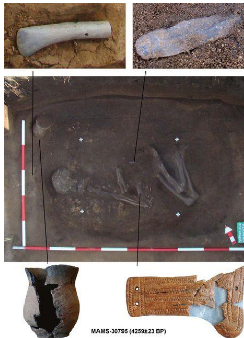
Kostrový pohřeb muže z období kultury se šňůrovou keramikou z Obříství (Mělník). Kromě keramické nádoby je součástí pohřební výbavy parohová pasová zápona (součást opasku), kamenný sekeromlat a pazourková čepel. Ca 2900 př. Kr.