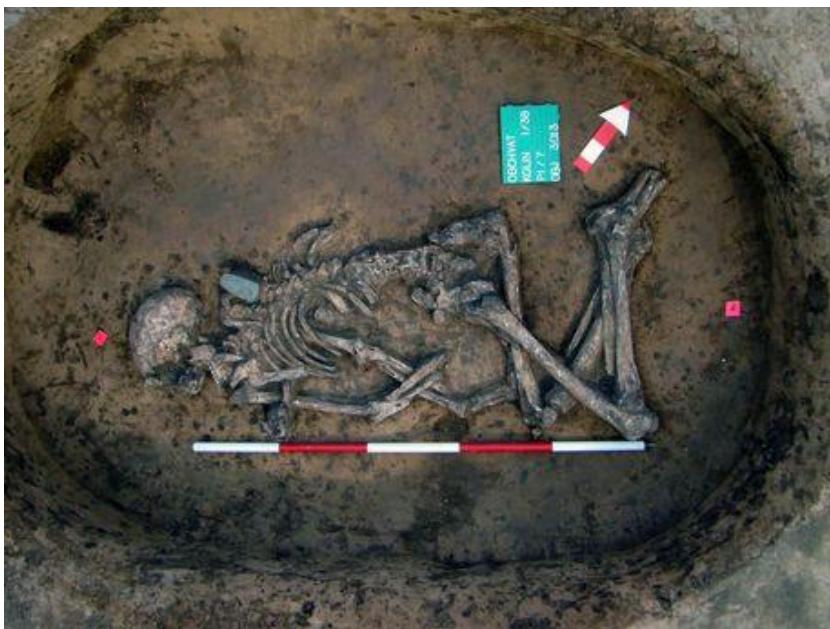
Kostrový pohřeb muže z období kultury se šňůrovou keramikou z Kolína (Kolín). Součástí pohřební výbavy je kamenná sekerka. Ca 2700–2500 př. Kr.