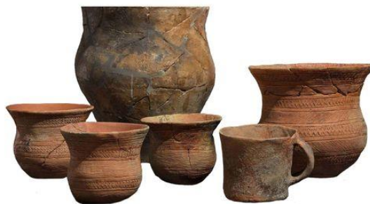
Výjimečná pohřební výbava hrobu z období kultury se zvoncovitými poháry z Tišic (Mělník). Sestává kromě šesti keramických nádob z měděné dýky a šídla, dvou zlatých součástí diadému a dvou kamenných nátepních destiček určených k ochraně předloktí při lukostřelbě. Ca 2500–2400 př. Kr.