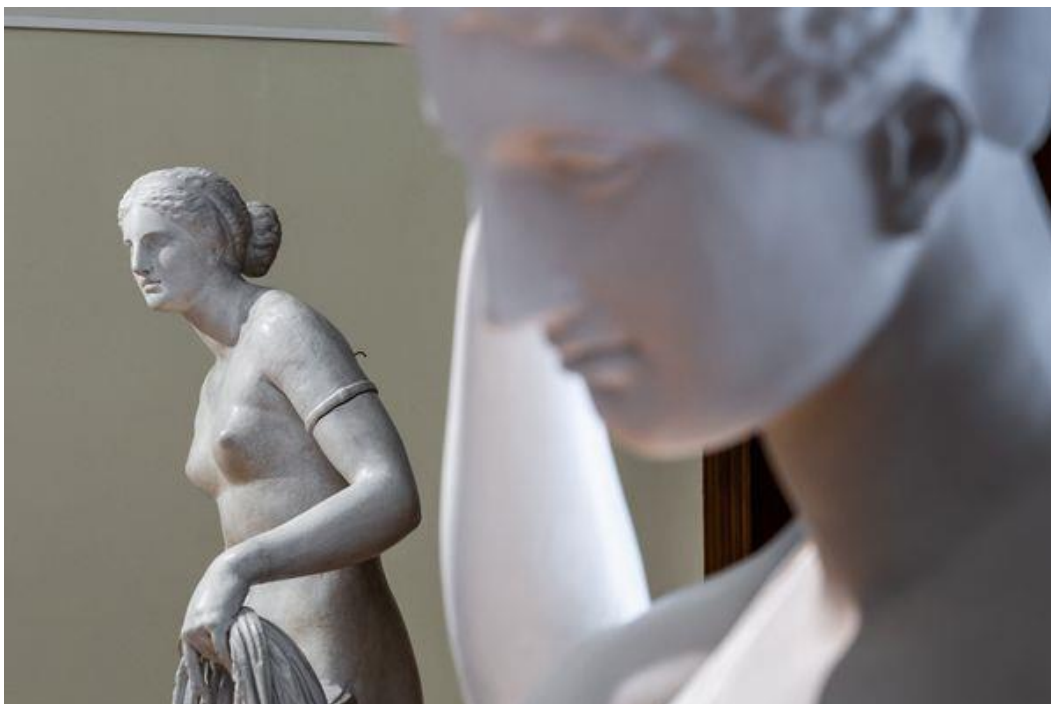
Sádrové odlitky nejslavnějších soch antické bohyně