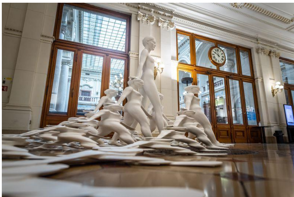
Oceňované moderní sousoší Zrození Venuše od Michala Gabriela