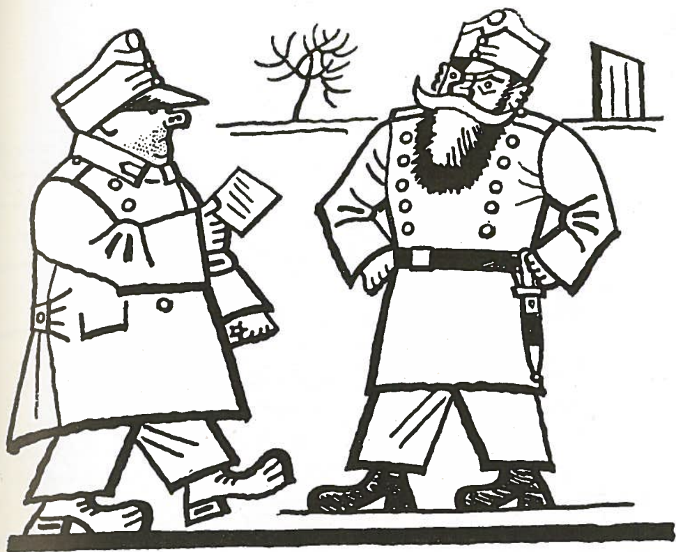
12. Z Ladových ilustrací k Osudům dobrého vojáka Švejka za světové války