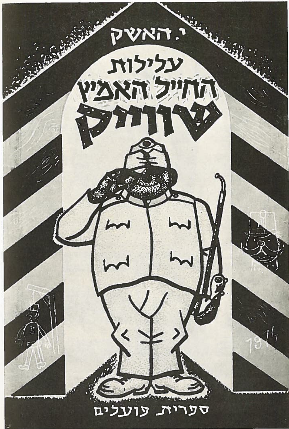
16. Obálka hebrejského vydání Haškova románu