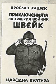
17. Ukázky zahraničních překladů Haškova románu