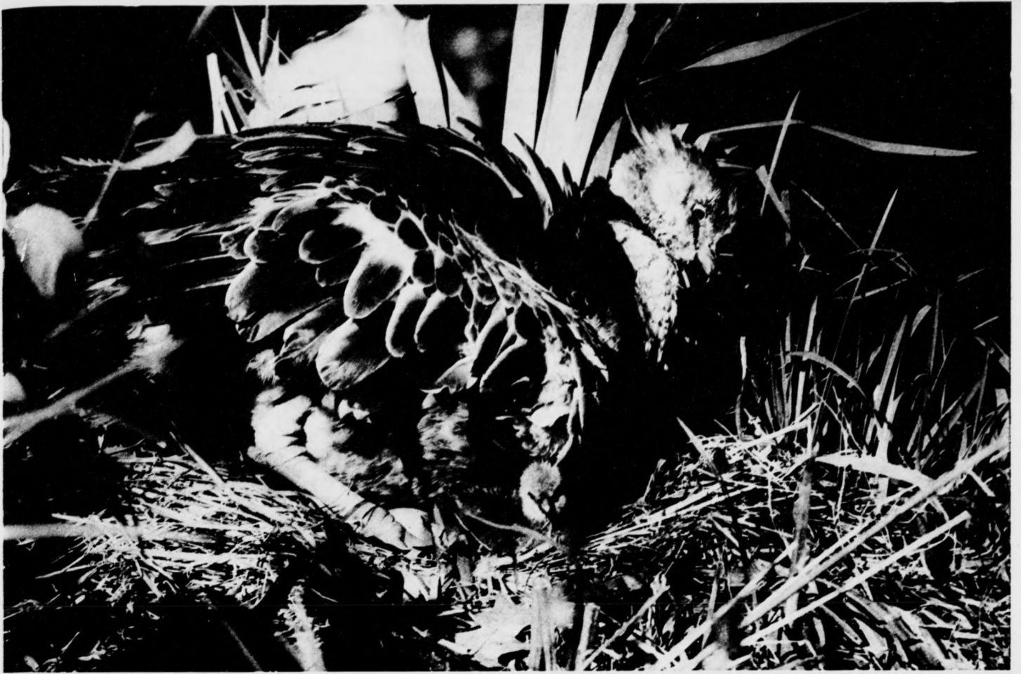
Samec čáji chocholaté ( Chauna torquata ) sedící na vejcích a vylíhlém mláděti (nahore) a chránící vylíhlá mláďata (dole). Na křídle je dobře patrný osten.