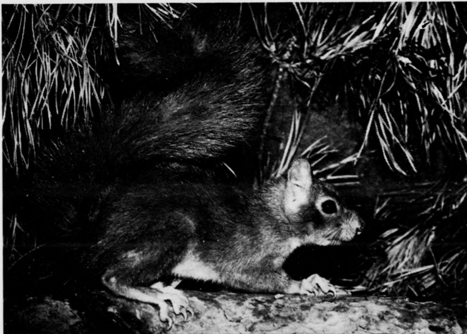
Veverka obecná — Sciurus vulgaris .

Mnohem výhodnější se naproti tomu jeví srovnání s některými klimatickými ukazateli, zvláště pak s průměrnou teplotou vzduchu a průměrným množstvím srážek. Černá forma veverky obvykle převažuje v územích s průměrnou lednovou teplotou -3 až -4 °C a nižší, dubnová izoterma odpovídá 5 — 6 °C a červencová 15 — 16 °C. U rezavé formy lze považovat za přibližně limitující lednovou izotermu -2 až -3 °C, dubnovou 7 — 8 °C a červencovou 17 — 18 °C. V celoročním průměru dává tmavá forma přednost oblastem s teplotou vzduchu nanejvýše 6 — 7 °C, rezavá pak upřednostňuje oblasti s hodnotami minimálně o 1 — 2 °C vyššími ( 7 — 8 °C). Není přitom bez zajímavosti, že areál dominantního výskytu tmavé formy více odpovídá zimním izotermám, zatímco pro rezavou formu mají větší význam spíše izotermery jarní nebo letní. To se ostatně projevuje i v porovnání s některými dalšími teplotními ukazateli. Např. areál převažujícího výskytu tmavých veverek dobře odpovídá oblastem s průměrným ročním počtem nejméně 130 tzv. mrazových dnů a 40—50 tzv. ledových dnů. Naproti to-