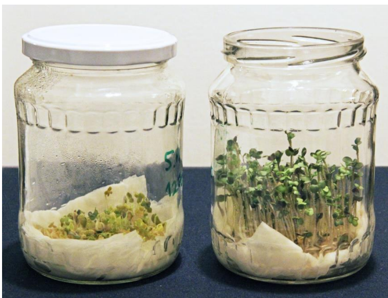
výsledek pokusu s hořčicí