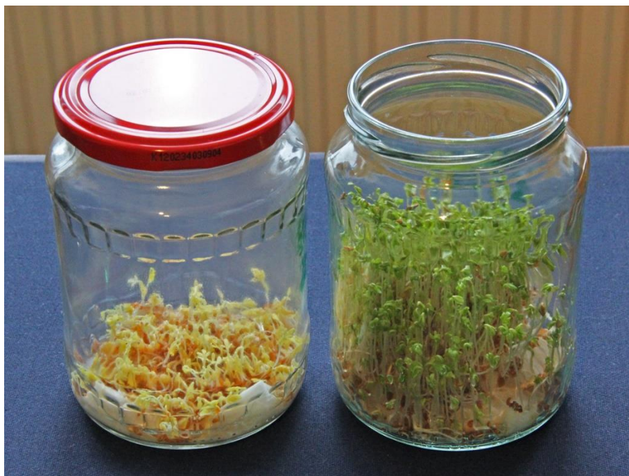
Klíčící rostlinky řeřichy po 5 dnech růstu v zavřené a otevřené sklenici.