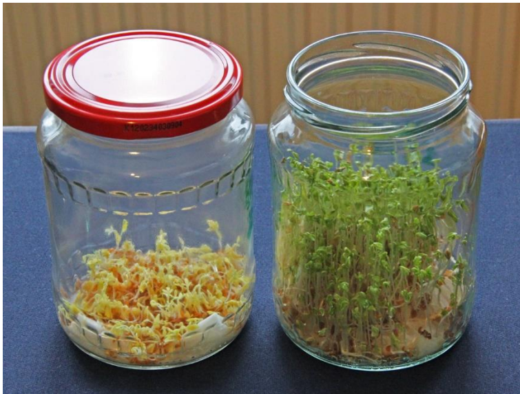
výsledek pokusu s řeřichou

Rostliny v uzavřené sklenici vypadají už po několika dnech experimentu na první pohled nezdravě. Jsou zakrnělé a velmi bledé. Mezi řeřichou a hořčicí si můžete všimnout menších rozdílů například v barvě děloh, které jsou u hořčice trochu zelenější. Celkový výsledek je ovšem jasný – vzduchotěsně zavřená sklenice klíčovím rostlinkám nesvědčí.