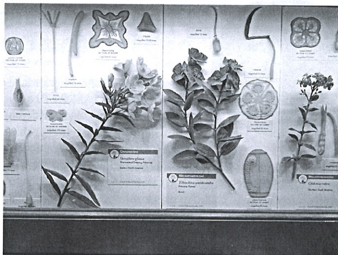
Modely rostlin zhotovené ze skla a drátu vystavené v expozici Muzea přírodní historie Harvardovy univerzity.