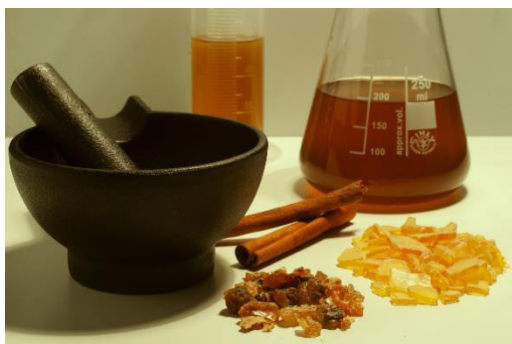
Replikace parfému Mendesian. Odměrný válec s datlovým olejem z pouště ( Balanites aegyptiaca ), hmoždíř a palička, myrha ( Commiphora myrrha ), borová pryskyřice ( Pinus sp. ), ostny skořice cassia, doplněný parfém v baňce.