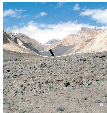
6 Střední část údolí říčky Rongdo Nullah. Šipka ukazuje na místo výskytu rdestu uzlinatého ( Potamogeton nodosus ).

Rdest uzlinatý je jediným makrofytním druhem vyskytujícím se na lokalitě, ale v bezprostředním okolí horkých pramenů roste několik dalších rostlin, které nikde jinde v údolí nenajdeme a jejichž maximální nadmořská výška je na ostatních lokalitách v Ladaku o několik set metrů nižší. Patří k nim především bezlodyžný oman Inula rhizocephala – druh, který na svých dlouhých chlupcích rostoucích po obvodu listů vychytává horkou vodní páru z pramenů, dále jeden druh rodu turan a jeden ze dvou zde rostoucích druhů rodu pampeliška. Výskyt rdestu uzlinatého je tedy potvrzen, což je malý důvod k oslavě! Vždyť většinu podobných podezřelých údajů nelze vůbec vyřešit a zůstanou navždy zařazeny mezi nejistými nebo pochybnými.