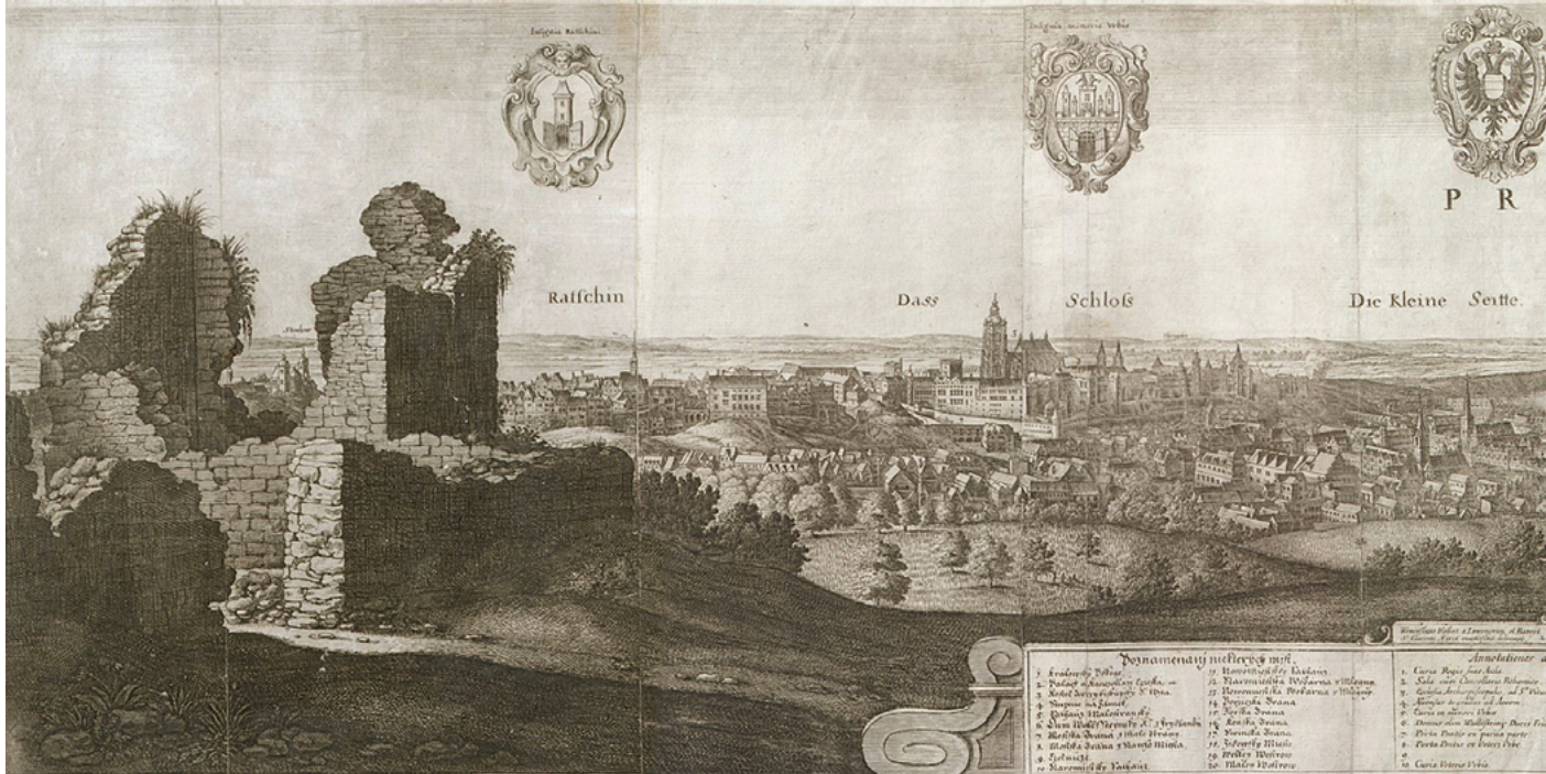
Obr. 28, 29: PRAGA, Panorama Prahy z Petřína, Václav Hollar, kolem 1650. Vydal: Matthaues Merian v publikaci Martina Zeillera, Topographia Bohemiae, Moraviae et Silesiae... 1. vydání, Frankfurt n. M. kolem 1650, rozměry 278 x 1 178 mm.