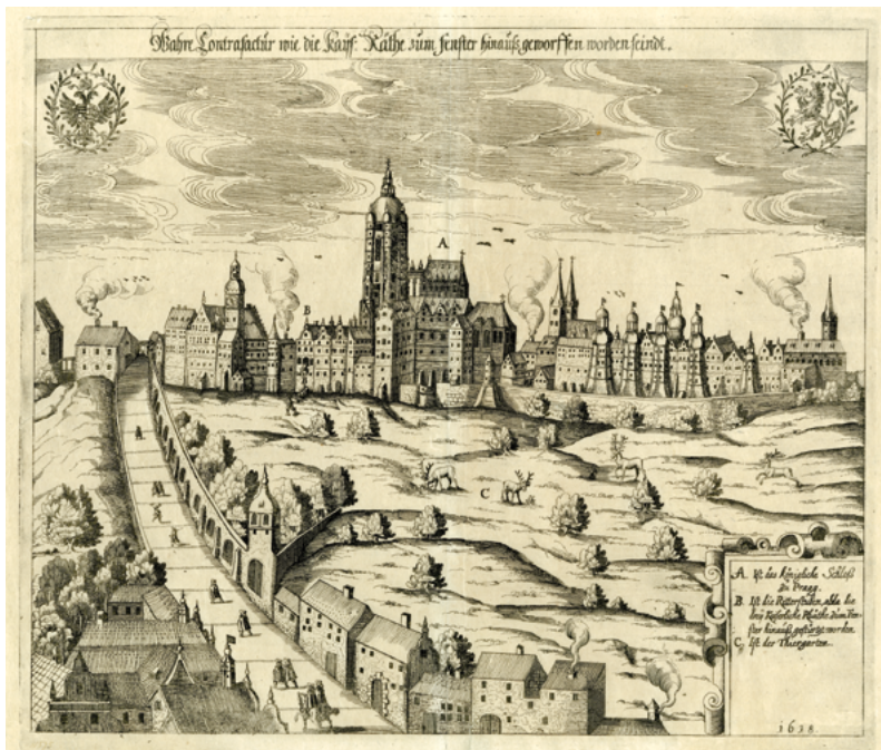
Obr. 26, 27: Vyhození českých místodržících z okna Pražského hradu 23. května 1618, mědiryt, 1627, rozměry 266 x 309 mm. Muzeum hlavního města Prahy, inv. č. 11575.