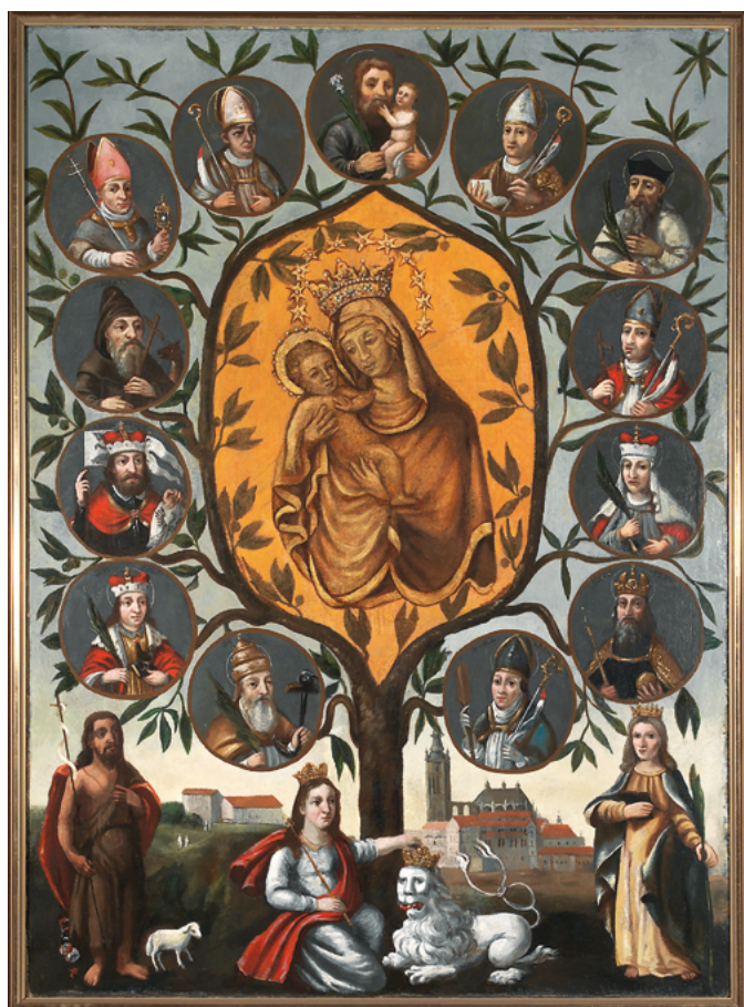
Obr. 32: Votivní obraz rétorů pražské jezuitské akademie s vyobrazením staroboleslavského Palladia, zemských patronů, sv. Jana Křtitele, sv. Kateřiny a Alegorie Čechie, 1562. Arcibiskupství Pražské, Kolegiální kapitula sv. Kosmy a Damiána ve Staré Boleslavi.