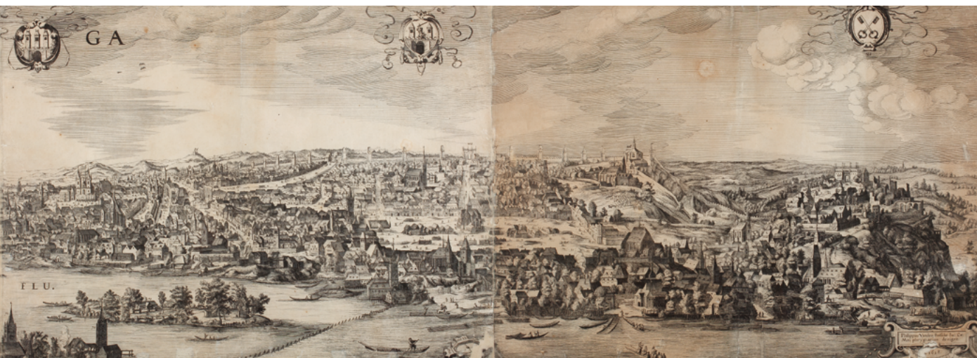
Obr. 23: Praha, tzv. Sadelerův prospekt, Filip van der Bossche (1606), mědirytina, vydal Jiljí Sadeler 1618, rozměry 420 x 2 234 mm. Muzeum hlavního města Prahy, inv. č. 17442.