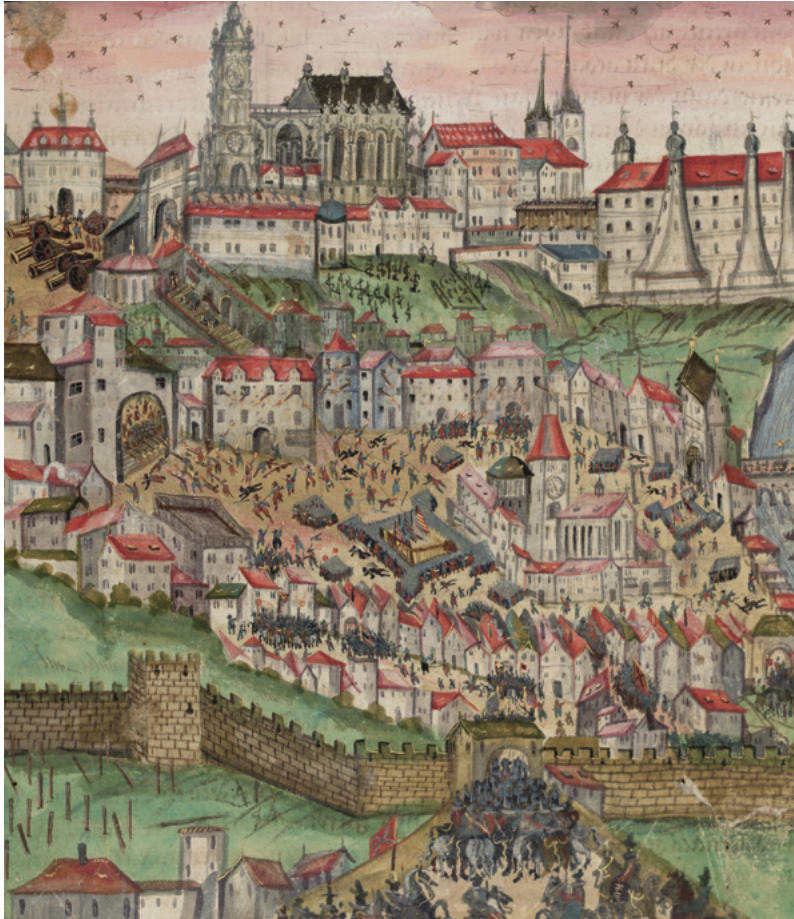
Obr. 24, 25: Pražský hrad na vyobrazení v deníku Jindřicha Hýzrle z Chodů z první poloviny 17. století. Vpád Pasovských na Malou Stranu 15. února 1611, z let 1612 až 1630, rozměry 25 x 21 cm. Národní muzeum, sig. VI A 12, Fol. 74b.