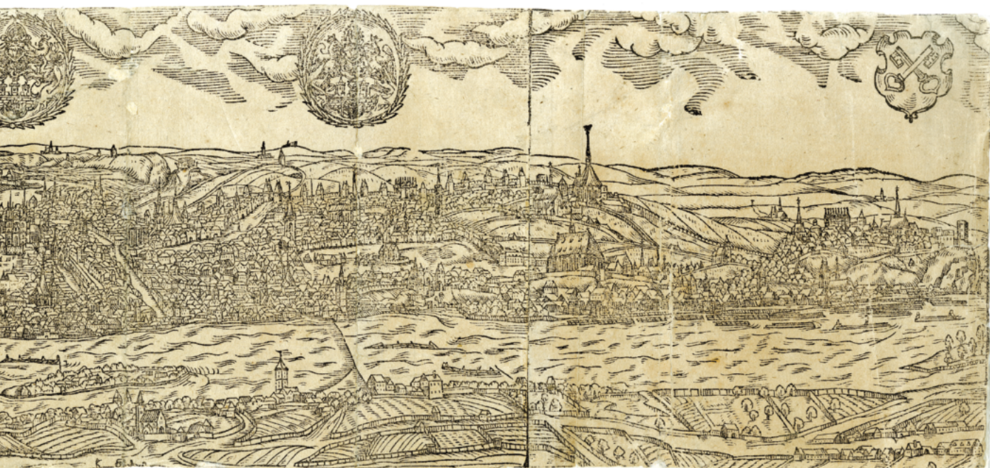
Obr. 21: Praha, Jan Willenberg, dřevorez, 1601, rozměry 135 x 578 mm. Muzeum hlavního města Prahy, inv. č. 27739 IIIA7.