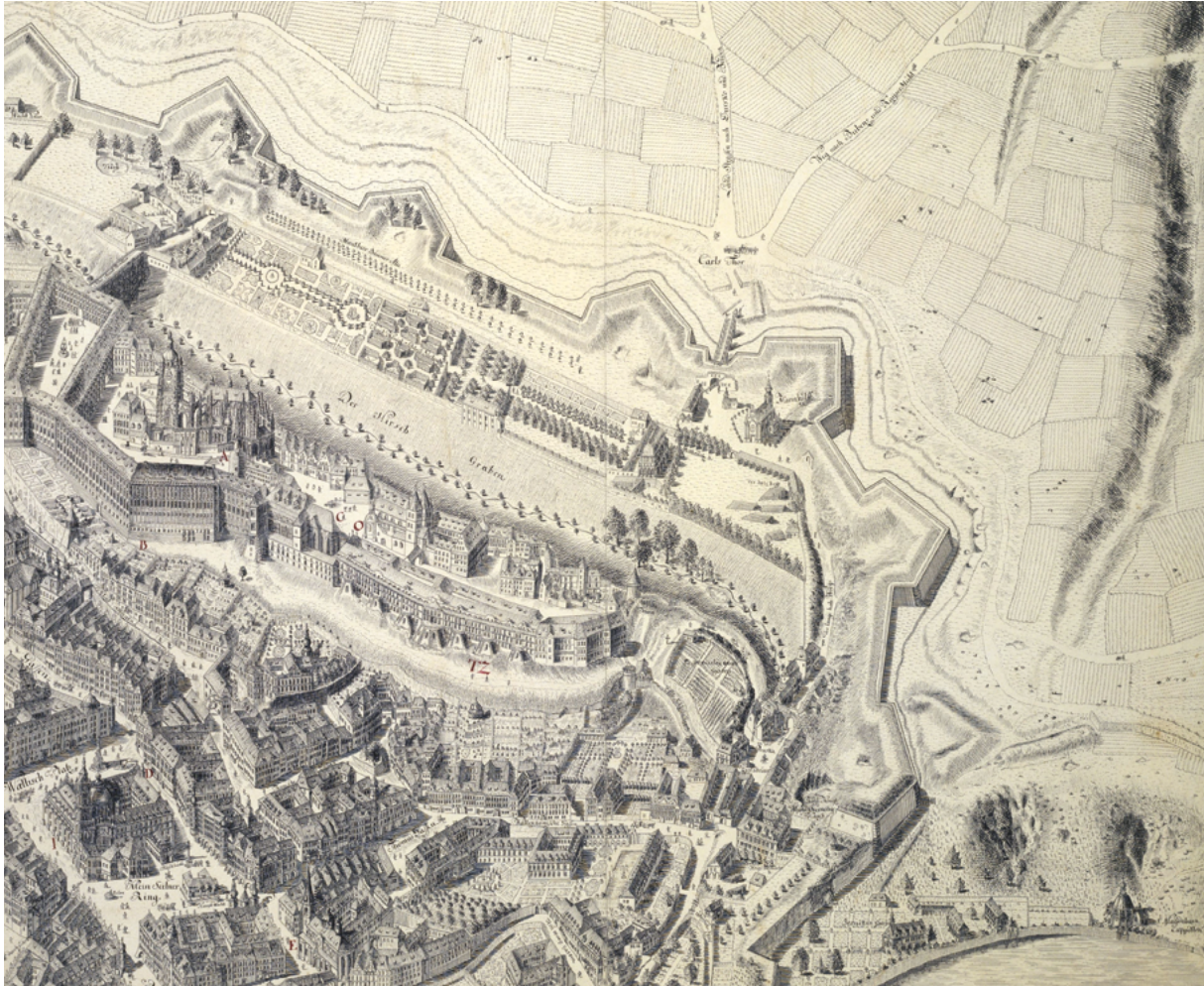
Obr. 35: Pražský hrad, Josef Daniel von Huber, tušová kresba perem, 1769, výřez. Plan von Prag „Wahre Laage Der Königlichen Haupt und Residentz Statt Prag des Königreich Böhmeimb in Orthographischen Aufzug von Osten bisz Westen anzusehen, ... aufgenommen u. gezeichnet im Jahr 1769“. Österreichische Nationalbibliothek, Wien.