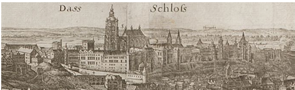
Fig. 28, 29: PRAGA, Panorama of Prague from Petřín Hill, Václav Hollar, around 1650. Published by: Matthaues Merian in Martin Zeiller's publication, Topographia Bohemiae, Moraviae et Silesiae... , 1st edition, Frankfurt am Maim, around 1650, size 278 by 1,178 mm. Prague City Archives, Collection of Graphics, sign. G 27a.