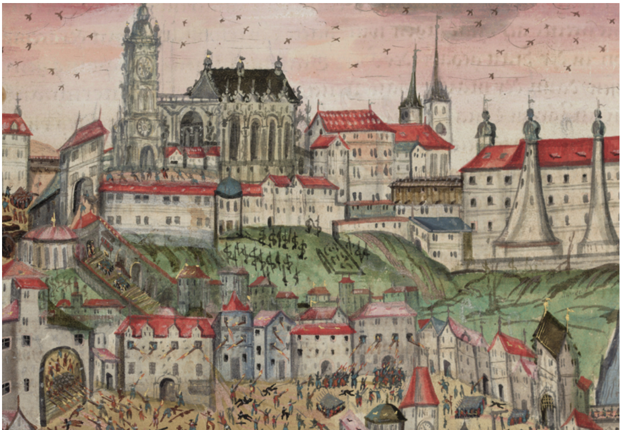
Fig. 24, 25: Illustration of Prague Castle from journal of Heinrich Hieslerle von Chodaw, first half of the 17th century. The Prague Uprising of 15 February 1611, from 1612 to 1630. National museum, sig. VI A 12, Fol. 74b.