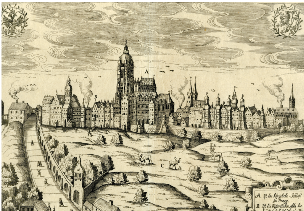
Fig. 26, 27: Defenestration from Prague Castle on May 23th 1618, copper engraving, 1627, size 266 by 309 mm. The City of Prague Museum, Inv. No. 11575.