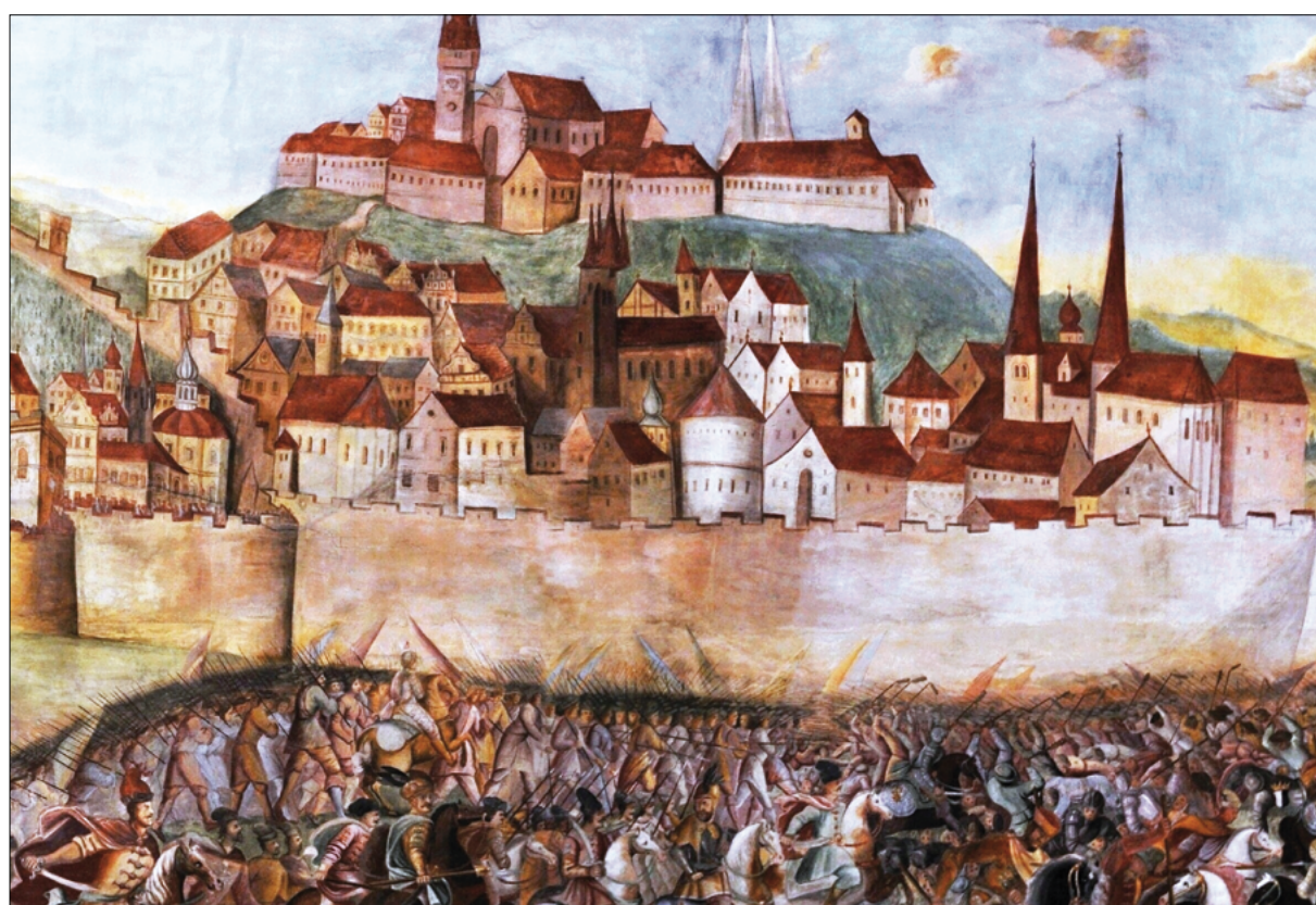
Obr. 33, 34: Nástropní freska na zámku v Horažďovicích. Městské muzeum Horažďovice. Foto: V. Šváb, 2016. Fig. 33, 34: Ceiling fresco in Horažďovice Castle. Horažďovice Town Museum. Photo: V. Šváb, 2016.