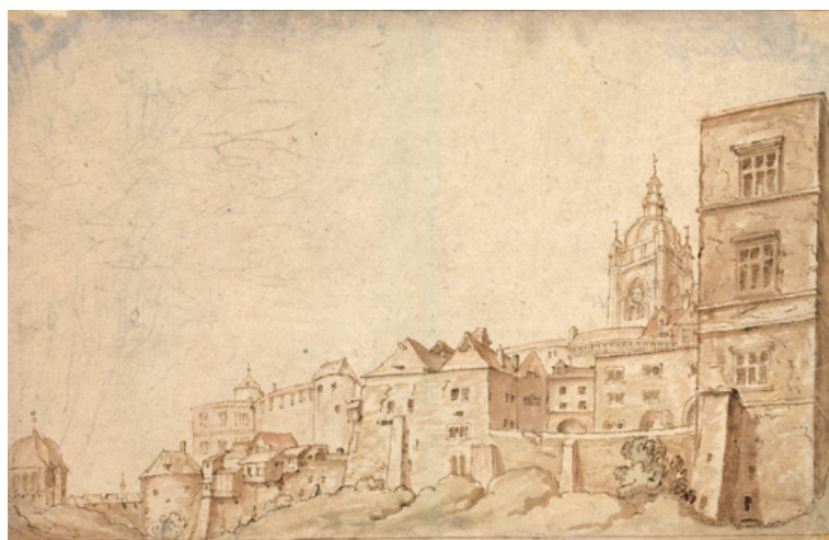
Obr. 22: Pražský hrad, hradní kuchyně, v pozadí tzv. lozumenty, Roelandt Savery (?), 1605. Albertina, Vienna.