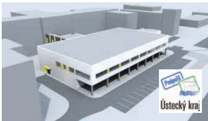
Pavilon operačních sálů a sterilizace – vizualizace.

„Je to poprvé během deseti let existence Krajské zdravotní, kdy se bude stavět něco nového. Celé generace teplických lékařů čekaly na tento okamžik, protože stávající operační sály skutečně neodpovídaly moderním požadavkům a standardům. Chci poděkovat panu hejtmánovi a zastupitelům Ústeckého kraje, protože akce bude postupně financována za podpory jediného akcionáře Krajské zdravotní, kterým je Ústecký kraj,“ řekl