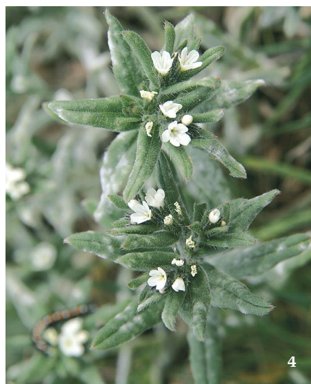
4 Kamejka rolní ( Lithospermum arvense ).

a na základě srovnávacích údajů i pro tehdejší ČSSR (Mathon 1968). Uvádíme jenom jako pionýrské příklady, na nichž se dá demonstrovat, do jak interpretačně zrádného terénu se badatelé dostali a dodnes dostávají.