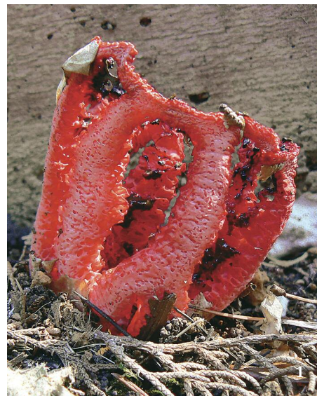
1 Mřížovka červená ( Clathrus ruber ) z chorvatského ostrova Rab. Uvnitř tmavé výtrusorodé pletivo – gleba. Foto M. Král

Častější je u nás příbuzný druh květnatec Archerův ( Clathrus archeri ) pocházející z australské a tasvánské oblasti, který byl do Evropy zavlečen začátkem 20. stol. asi se zásilkou bavlny a který se v České republice začal poměrně rychle šířit od západu k východu. V současné době již roste na mnoha místech po celé zemi. Pátým rokem jej sbíráme od července do října např. v chatové osadě Suchý Žleb v Hlubočkách u Olomouce. Květnatec zde roste v zahrádkářské kolonii v zastíněném porostu mechu s tlejícími organickými zbytky. Zářivě červená ramena (v počtu 4–7, o délce 7–11 cm) vyrůstající z vajíčka jsou zpočátku srostlá, později se rozklá-