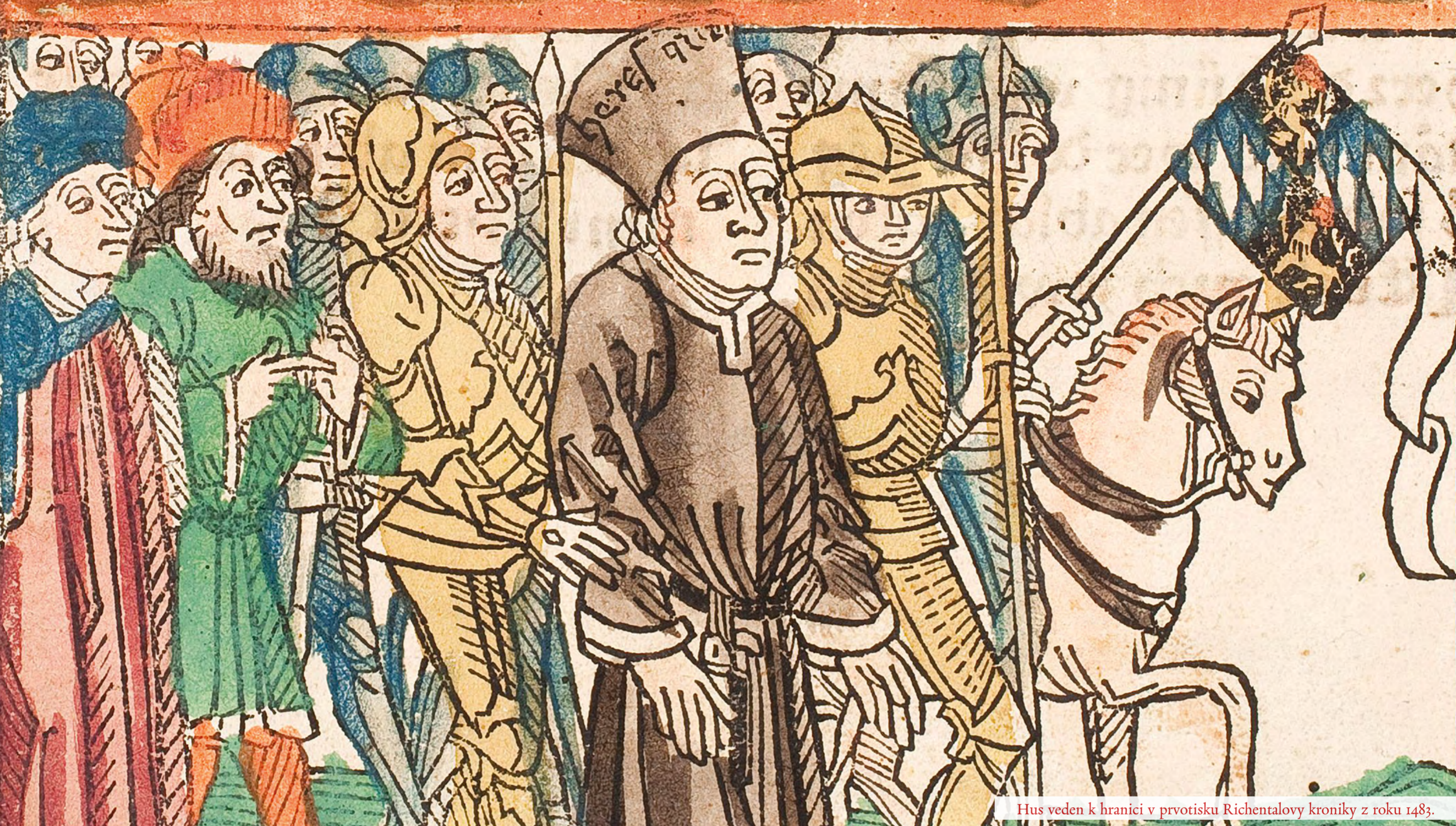
Hus veden k hranici v prvotisku Richentalovy kroniky z roku 1483.