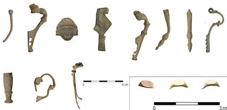
Mosazné předměty z ČR.