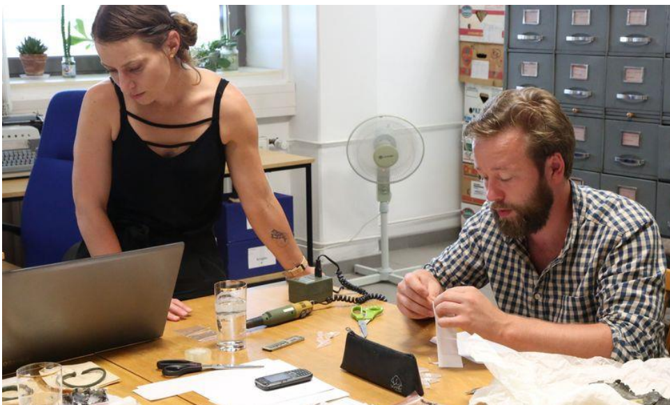
Příprava vzorků pro analýzy