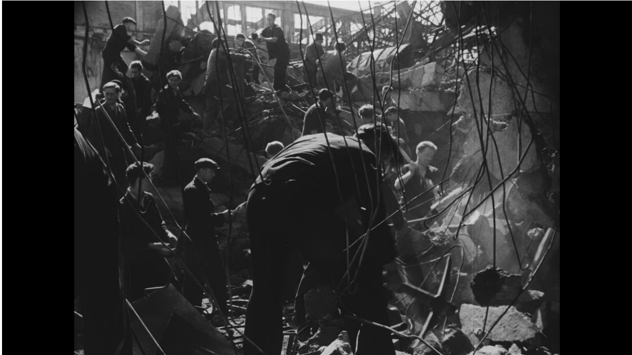
Záběr z dokumentárního filmu Kováci režiséra Jiřího Krejčíka, 1946.

Z celkem patnácti kapitol, které společně nabízí jedinečné transnacionální vyprávění o obnově veřejného prostoru v Evropě, může české publikum ocenit například téma Zkáza a znovuzrození uměleckého dědictví , jež se věnuje stavební rekonstrukci kulturních památek zničených válkou. Ukazuje domácí symbol válečné zkázy, jímž se stala Staroměstská radnice, kterou nacisté vypálili během Pražského povstání, a z pozdější doby upozorňuje na pozoruhodný příběh obnovy Betlémské kaple.