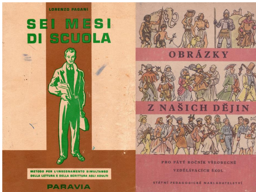
Titulní strana italské a české poválečné učebnice, 1959.

Důležitou součástí výstavy jsou učební materiály a soubory e-learningových aktivit, které jsou určeny pro studenty ve věku 14 až 18 let, ale lze je přizpůsobit i mladším žákům. Dvanáct hlavních aktivit, které navazují na témata výstavy, je navrženo tak, aby v rámci jedné vyučovací hodiny (45 minut) motivovaly studenty ke kritickému pochopení historického tématu. Pět kratších aktivit, které by měly trvat přibližně 15 minut, se věnuje konkrétním filmovým formám. V každém případě jsou studenti vedeni ke kritickému vnímání obrazového a filmového materiálu, což je dovednost, kterou zdaleka nevyužijí jenom v hodinách dějepisu.