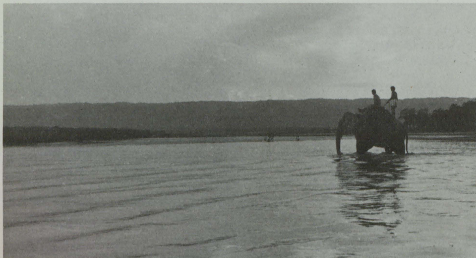
Národní park Chitwan je ze severu ohraničen řekou Rapti

Divocí sloni indiští ( Elephas maximus ) se na území parku zatoulají jen zřídka ze sousední Indie. Zato je zde celkem hojný levhart indický ( Panthera pardus fusca ) a medvěd pyskatý ( Melursus ursinus ), který patří pro svou útočnost k nejobávanějším živočichům Chitwanu. Z přežvýkavců se mezi největší atrakce parku rozhodně řadí gaur ( Bos gaurus ), který žije velice skrytě v podhorských lesích Siwaliku a