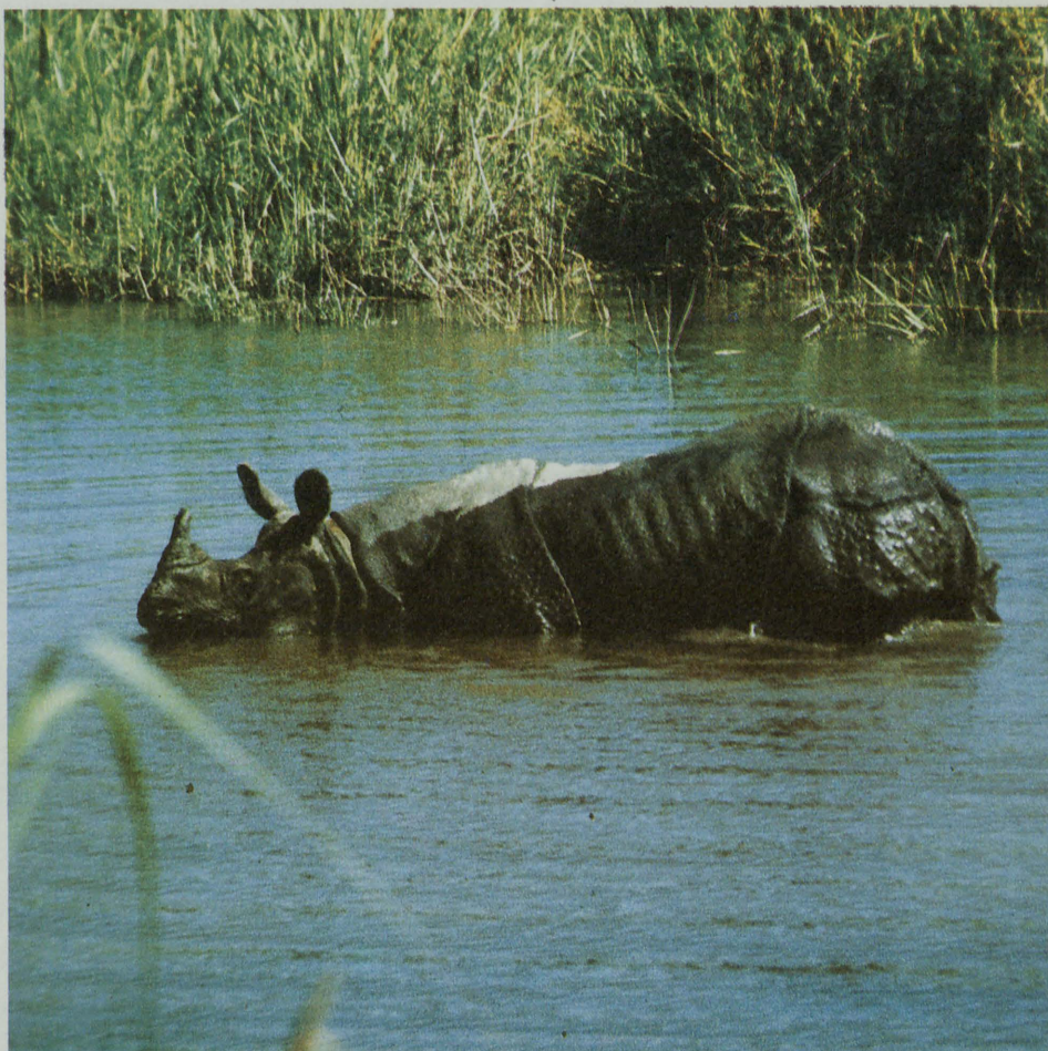
Nosorožec indický ( Rhinoceros unicornis ) v národním parku Chitwan svou populaci zvětšuje.

Národní park Chitwan je přístupný z malé vesnice Saura, která leží na břehu řeky Rapti. Po zaplacení vstupného (za každý den 3 dolary) je nutné buď přebrodit Rapti, nebo se nechat převézt na nesmírně vratkém člunu vydlabaném z jednoho kmene. Vstup do parku bez průvodce je povolen pouze na vlastní nebezpečí. Každý rok zde totiž nosorožci usmrtí 2–3 turisty, občas někoho zabije tygr a napadení medvědem pyskatým je prý dosti časté. Kupodivu zde nejsou problémy s levharty, i když jich na území parku žije dost. Pro hromadné vyjíždky po jediné cestě, která se táhne