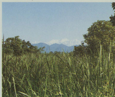
Himálaj tvoří kulisu národního parku Chitwan

Lužní les tvoří pouhých 7 % plochy parku a roste na půdách minimálně 3 měsíce podmáčených. Vůdčími dřevinami jsou zde