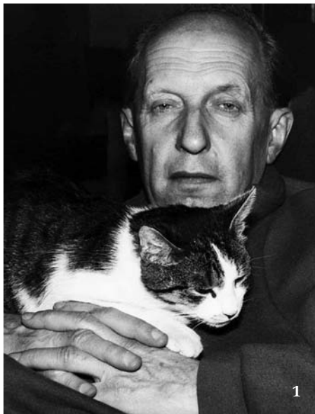
1 Odpočinek s kocourem.