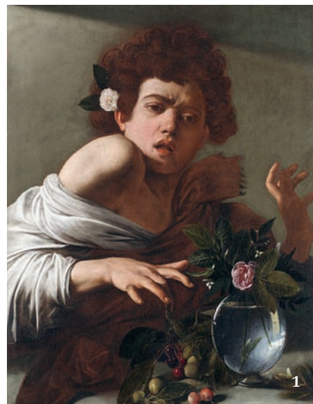
1 Chlapec kousnutý ještěrkou. Michelangelo Merisi da Caravaggio (1596)

Caravaggio si motiv možná vypůjčil z díla Dítě kousnuté rakem (1554) kremonské malířky Sofonisby Anguissoly, dnes k vidění v Národním muzeu Capodimonte v Neapoli (obr. 2). Tento obraz vyjadřuje rozdílné emoce plačícího kousnutého chlapce Asdrubala, malého bratra Sofonis-