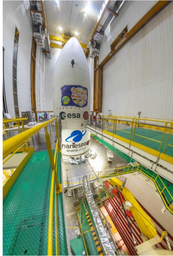
Zakrývání sondy JUICE upevněné na špičce nosné rakety Ariane 5 aerodynamickým krytem se uskutečnilo 4. dubna v montážní budově BAF (Bâtiment d'Assemblage Final) na kosmodromu Kourou ve Francouzské Guyaně.