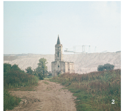
2 Historický snímek (r. 1982) zanikající obce Radovesice pod postupující výsypkou

Mostecké výsypky mají pověst měsíční krajiny. Tak se ale mohou jevit jen krátce po nasypání. V podstatě okamžitě začne proces primární sukcese. (Primární sukcese probíhá na substrátech, na kterých není vyvinuta půda a neobsahuje semena ani jiné rozmnožovací částice rostlin – např. výsypky hlušiny, odledněná území, písečné duny. Naopak sekundární sukcese probíhá na stanovištích s již vytvořenou půdou a zásobou semen – např. opuštěná pole). Semena rostlin přináší na výsypky vítr, živočichové a někdy i člověk již při jejich zakládání. Nejprve převládnu jednoletky, jako jsou lebeda lesklá ( Atriplex sagittata ) a l. hrálovitá ( A. prostrata ), merlíky (hlavně m. tuhý – Chenopodium strictum ), rdesno blešník ( Persicaria lapathi-