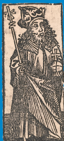
Vyobrazení císaře Karla IV. ve Světové kronice Hartmanna Schedela, které uvádí výklad o Karlově životě a díle.

Světová kronika Hartmanna Schedela zachycuje pohled na Prahu na konci 15. století. Ukazuje tak mj. i nedostavěnou katedrálu sv. Víta na Pražském hradě. V době vlády Karla IV. se Praha stala rezidencí císaře a centrem politického a kulturního života říše. Velkolepá založení mnoha církevních i světských staveb přinesla městu rozkvět, ale také významně zatížila královskou pokladnu.