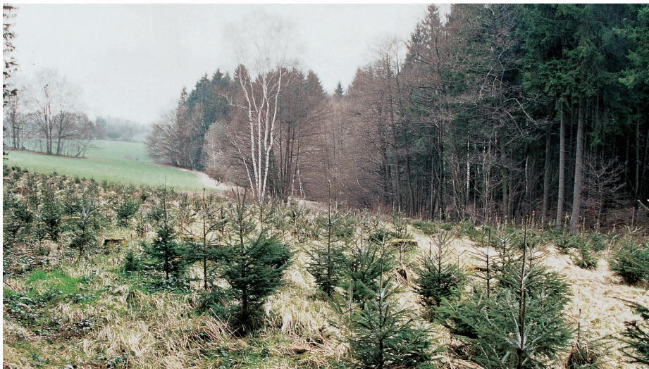
Paseka se opět zalesňuje smrkem, který na půdách prorostlých byfami dřevokazných hub roste jako z vody. V této generaci smrku bude v 80 letech věku postiženo hnilobou již plných 100 % stromů. ♦ V nepřírodných monokulturách jsou přírodní procesy potlačeny a nahrazeny manipulací. V plném rozsahu se naopak mohou uplatnit v přírodě blízkém lese — bučina na Zákovské hoře na Českomoravské vrchovině.