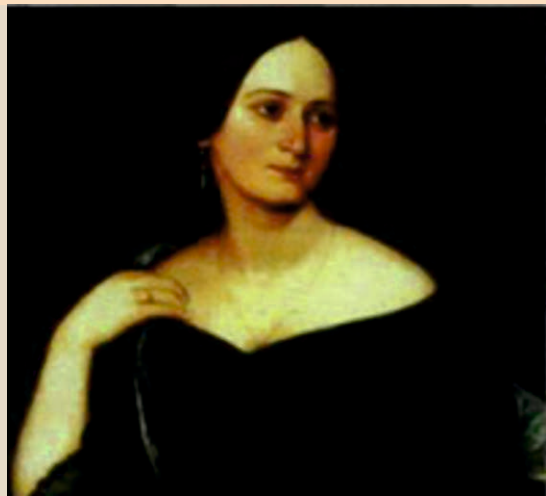
J. V. Hellich: Božena Němcová, 1845