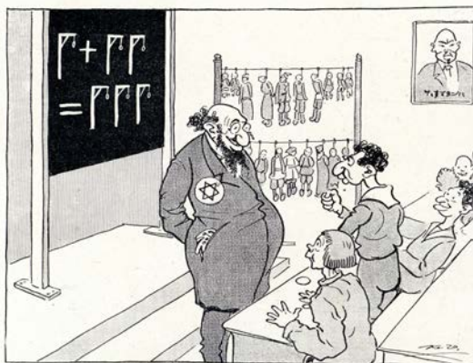
„Názorné“ komunistické vyučování.