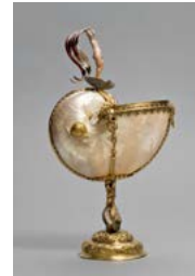
Pohár z lastury nautila Marx Kornblum / kolem 1580/1590