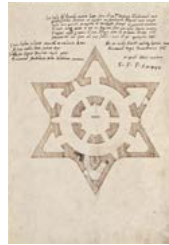
Album plánů letohrádku Hvězda kolem 1555