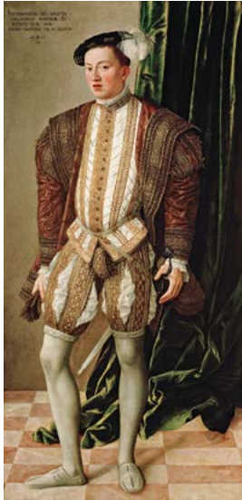
Arcivévoda Ferdinand II. jako správce zemí Koruny české Jakob Seisenegger / 1548

ÚSTAV DĚJIN UMĚNÍ AKADEMIE VĚD ČESKÉ REPUBLIKY, V.V.I.