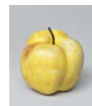
Mramorové jablko Itálie (?) / konec 16. století