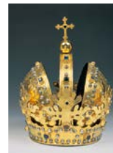
Císařské pohřební insignie ze svatovítského pokladu / Císařská koruna Augšpurk nebo Praha / 1576-1577