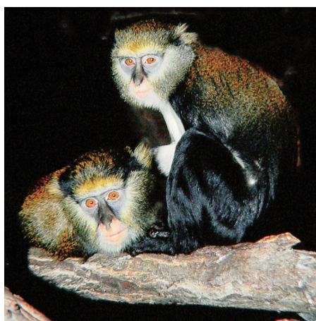
Nahore: Samec mačička Rolowayovho v Zoo Heidelberg ♦ Uprostred: Mačiak červenobruchý (kočkodan červenobruchý — Cercopithecus erythrogaster erythrogaster ) v Zoo Mulhouse je jediný registrovaný exemplár v zoo na svete ♦ Dole: Mačiak Campbellov (kočkodan Campbellův — Cercopithecus campbelli ) v Zoo Ústí. Dnes pár žije v Zoo Jihlava. Snímky P. Luptáka

riadal súťaž pre deti v kreslení, zabezpečil, aby každý druh v zoo mal svoju informačnú ceduľku, vydal leták o ohrozených primátoch, zorganizoval školenie o chove sarančiat a traja ošetrovatelia zvierat boli vyslaní s podporou Svetovej asociácie zoo a akvárií (WAZA) na odbornú stáž do anglických zoo. Pri zoo je zriadené centrum pre ohrozené primáty, kde je niekoľko potenciálnych jedincov pre Európske záchranné programy (EEP).