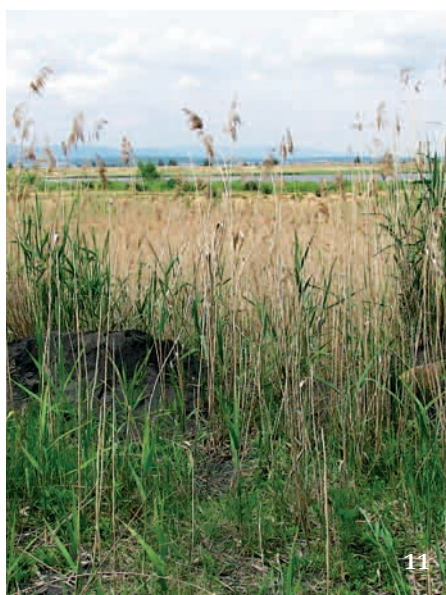
11 Nebezpečím pro mnohá popílkoviště je spontánní sukcese po ukončení ukládání popílku. Některé invazní a expanzivní rostliny dokáží během několika let zcela zarůst menší lokality, jako se to stalo i na odkališti českobudějovické teplárny, kde již několik let nebyl pozorován svižník písčinný.

těch specializovaných na váté písčiny, na rekultivovaných plochách nežijí, a to ani když jsou tato místa nedaleko od ploch dosud ponechaných spontánnímu vývoji. Zvláště nově vytvořené plantáže dřevin vykazují extrémně nízkou biodiverzitu všech studovaných skupin (Tropek a kol. 2014).