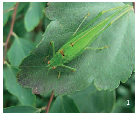
1 Samec kobylky malé ( Phaneroptera nana ) na tavolníku van Houtteově ( Spiraea × vanhouttei ) pozorovaný v parku na Karlově náměstí v Praze (2013)

a dosud se jí podařilo najít na několika pražských lokalitách v souvislosti s projektem Mapování rovnokřídilých v ČR – tato data však zatím nebyla publikována.) V atlasu Rovnokřídilí České republiky (Kočárek a kol. 2013) autoři uvádějí výskyt dospělců od července do října a druh považují za arborikolní – kobylky malé žijí v korunách stromů a vyšších keřů. Samci zde v noci cvrkají; stridulace, která u toho-