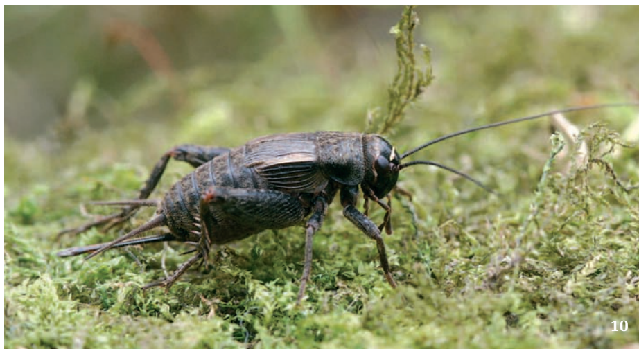
10 Cvrček malý ( Modicogryllus frontalis ) z krátkostébelných stepí Českého středohoří byl od 80. let 20. stol. v Čechách považován za vyhynulého. V r. 2010 se ho podařilo objevit na odkališti tušimické elektrárny.

Jak jsme zmínili v úvodu, prakticky všechna středoevropská popílkoviště jsou pod tlakem na co nejrychlejší rekultivaci, a to z důvodů ochrany okolního prostředí a zdraví místních obyvatel. Taková rekultivace vždy spočívá ve vysušení případné odkalovací nádrže, překrytí celé plochy popílku různým inertním materiálem a následně úrodnou ornici a následným vytvořením kulturní louky nebo hospodářského lesa (obr. 4). Tento zásah je naprosto fatální pro unikátní vlastnosti všech zajímavých stanovišť, která se na popílkovištích tvoří, a jejich nahrazením jedněmi z nejchudších společenstev, jaká ve střední Evropě máme (o podobném vlivu těchto rekultivací na jiná postindustriální stanoviště viz také Živa 2009, 2: 68–72). Toto jsme dostatečně prokázali i experimentálně při našem výzkumu ve východních Čechách. Jasně se totiž ukázalo, že drtivá většina ohrožených druhů, především