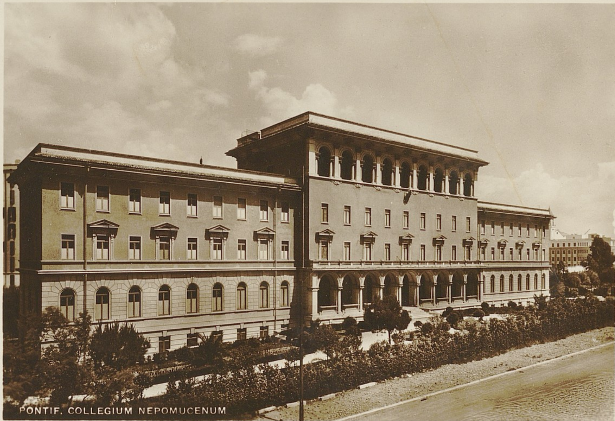
PONTIF. COLLEGIUM NEPOMUCENUM