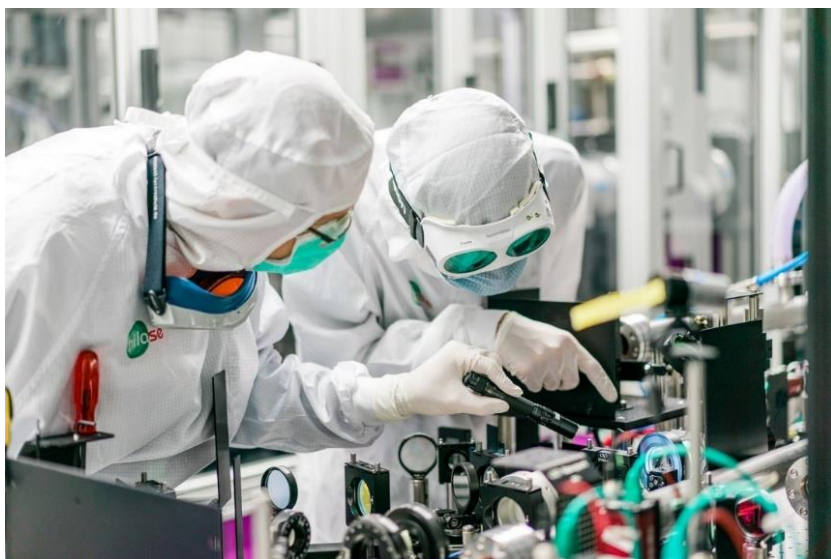
Fyzikální ústav AV ČR – Centrum HiLASE / Experimentální platforma pro vývoj tenkodiskových laserů