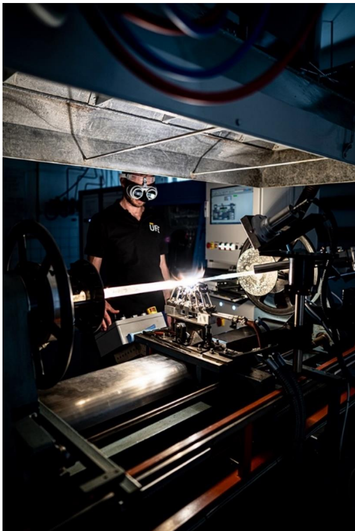
Ústav fotoniky a elektroniky AV ČR / Sklářský soustruh pro přípravu preformy optického vlákna, tyčinky z křemenného skla o průměru srovnatelném s lidským vlasem