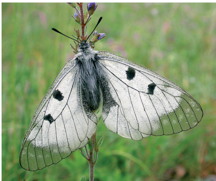
Jason dymnivkový (Parnassius mnemosyne) vlivem frézování pasek nedávnou téměř zmizel z obory Soutok u Břeclavi. Frézovány jsou i jeho biotopy v Milovickém lese v CHKO Pálava.

půdy tak přímo ničí místa vývoje ohroženého a evropsky chráněného druhu. Roháč přitom ustupuje na celém kontinentu a v některých státech severní a západní Evropy už vyhynul. Značný je i jeho úbytek v Čechách, na severní Moravě a ve Slezsku. Roháč je předmětem ochrany např. v evropsky významné lokalitě Niva Dyje, kde se ale celoplošná příprava půdy běžně používá.