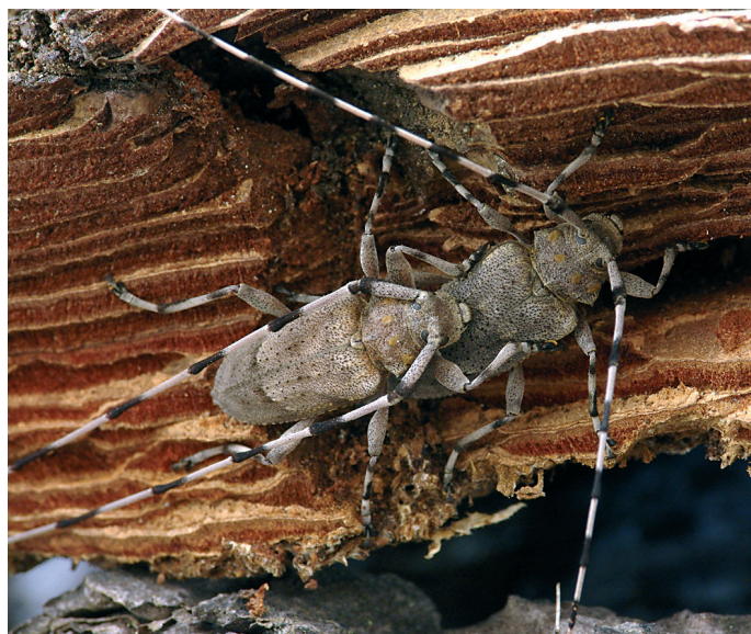
Kozlíček dazule (Acanthocinus aedilis) žije v borových lesích, kde se jeho larvy vyvíjejí především v pařezech.

Že mechanická příprava půdy neohrožuje jen saproxylické organismy, ukazuje příklad jasoně dymnivkového ( Parnassius mnemosyne , viz obr.), kriticky ohroženého druhu přílohy II směrnice 92/43/EHS a současně podle naší národní legislativy chráněného v kategorii druhů silně ohrožených (Živa 2000, 1: 28–29). Tento motýl původně obýval světlé lesy a jeho housenky žijí na listech dymnivek, typických rostlin hajního podrostu. Jelikož housenky potřebují dymnivky osluněné, nemohou přežít v zapojeném lese. V produkčních lesích tak jason obývá pouze lesní lemy a paseky, kde se housenky živí dymnivkami, které původně rostly v lesním podrostu, ale po odtěžení porostu se dostaly na slunce. Tento kdysi běžný motýl může žít od nížin až po horní hranici lesa, ale vzhledem ke svým nárokům