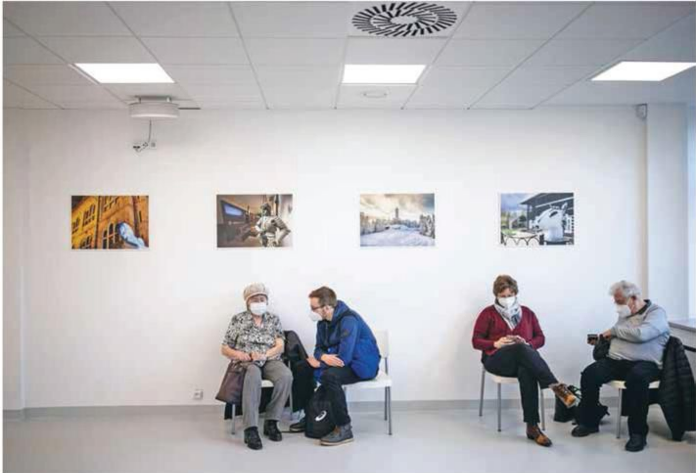
Kde to vážně? (Čekání na vakcínu, Liberec)