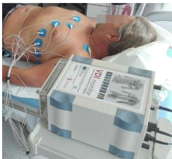
Obr. 1: Použití UHF-ECG v praxi

Vinohrady v Praze. Kromě zlepšení zdravotního stavu nemocných lze očekávat i jejich delší pracovní aktivitu a další socio-ekonomické benefity pro společnost.