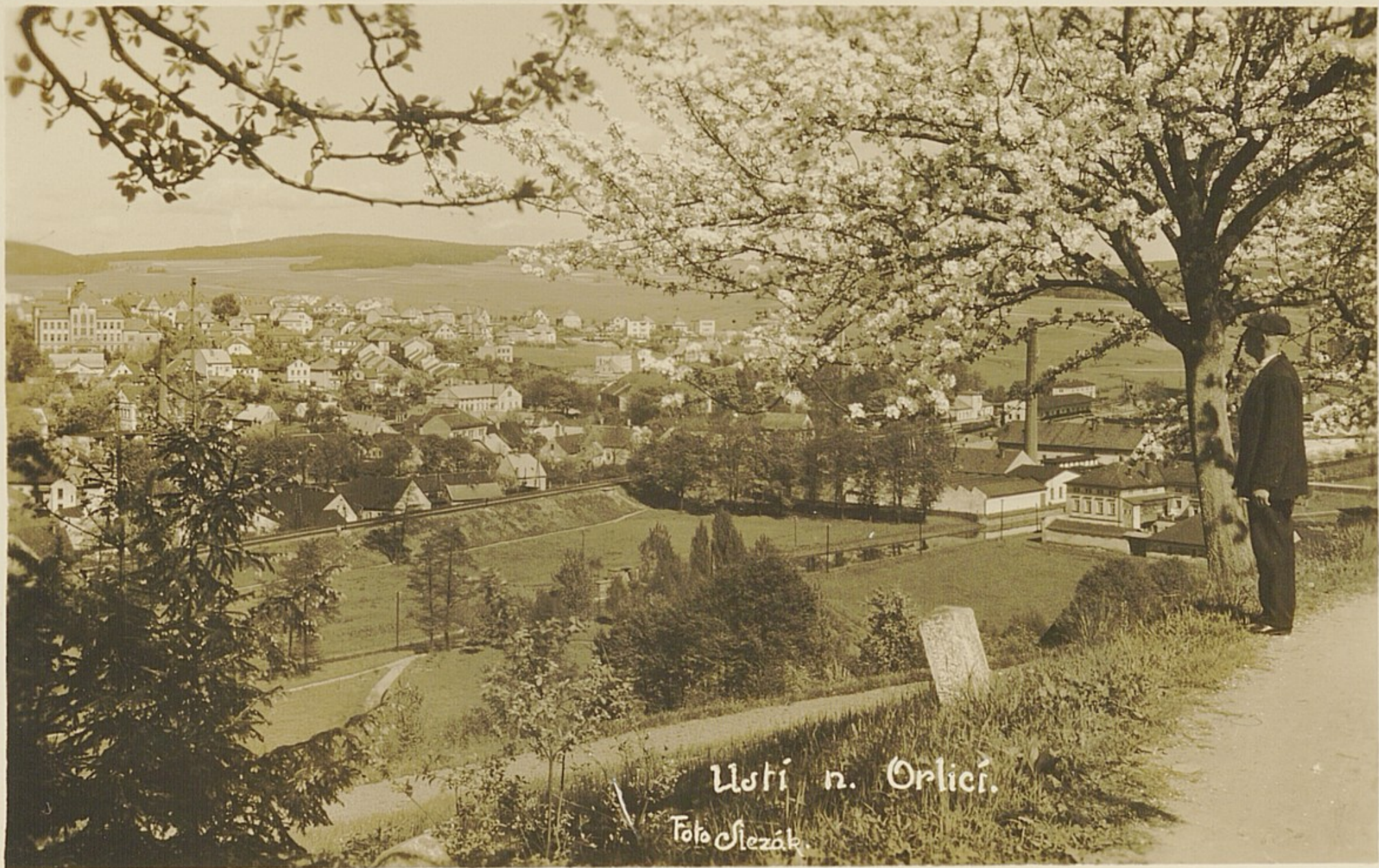
Ustí n. Orlicí.